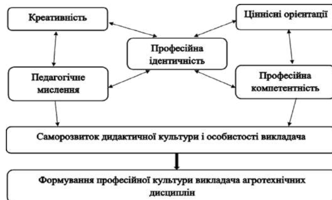
Рис. 1. Складові дидактичної культури викладача агротехнічних дисциплін

прикладного використання у сфері аграрного виробництва; ціннісні орієнтації та переконання; педагогічне мислення; креативні та творчі можливості (рис. 1).