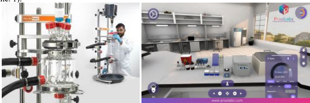
Рис 1. Модель змішаного навчання у курсі «Біохімія»: ліворуч – традиційний лабораторний експеримент, праворуч – віртуальна симуляція (зображення ілюстративне)

Крім того, очні експерименти, наприклад з білковим електрофорезом, ефективно доповнюються симуляціями у PhET, що забезпечує наочну візуалізацію молекул і підсилює засвоєння складних біохімічних процесів (рис. 1).