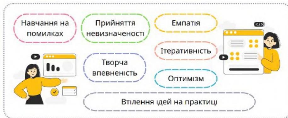
Рис. 1. Принципи людиноорієнтованого дизайну (за матеріалами [3])

Ітеративний підхід, що пов'язаний з гнучкими (agile) підходами до інженерного проектування, передбачає розробку продукту або рішення через постійне вдосконалення, включаючи створення прототипів, тестування, отримання зворотного зв'язку, внесення змін і повторення циклу. Ітерації дозволяють враховувати змінні потреби користувача, виправляти недоліки, отримувати найкраще рішення не за один підхід, а через послідовні вдосконалення. Це вимагає від студентів терпіння, наполегливості та готовності переглядати свої ідеї.