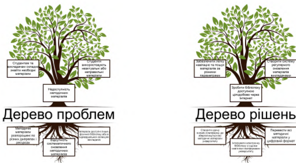
Рис. 2. Дерево проблем та дерево рішень проєкту «Чат-бот методичних матеріалів кафедри АКІТ»

Дерево проблем – це візуальний інструмент, що допомагає проаналізувати проблему, розклавши її на ключову проблему (стовбур), її причини (коріння) та наслідки (крона дерева). Він допомагає побачити, як різні фактори пов'язані між собою. Дерево рішень будується на основі дерева проблем і показує, як можна вирішити ключову проблему: воно включає основну мету, шляхи її досягнення (цілі) та очікувані результати. Його часто використовують для планування проєктів. На рис. 2 наведено дерева проблем і рішень для проєкту «Чат-бот методичних матеріалів кафедри АКІТ», створені на початковому етапі планування боту.