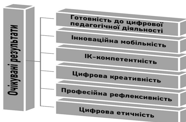
Рис. 3. Очікувані результати реалізації педагогічних умов формування цифрової компетентності

Очікувані результати реалізації педагогічних умов формування цифрової компетентності мають багатовимірний характер і охоплюють як когнітивну, так і особистісно-професійну сфери розвитку майбутніх учителів інформатики (рис. 3).